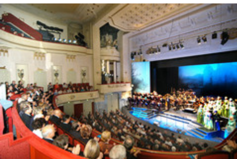
Staatstheater Cottbus - Zuschauerraum und Bühne