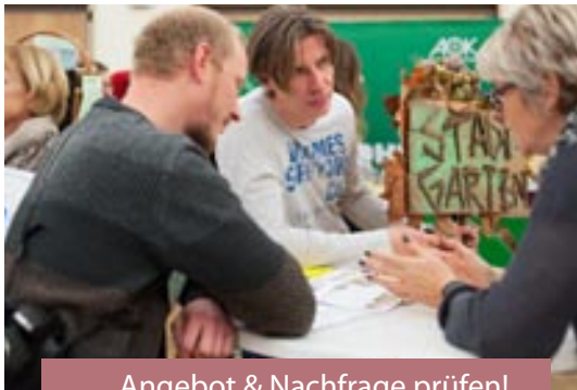
Angebot & Nachfrage prüfen!