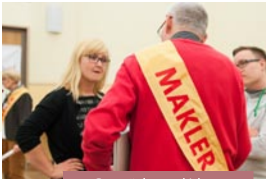
Gespräche und Ideen ...