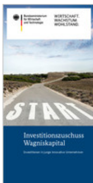
Flyer (PDF / 404.0 kB)